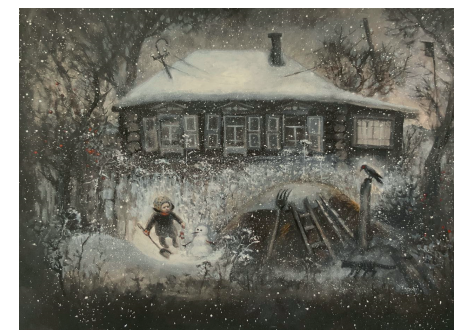
Olya Lookoevna. Snow maiden . 2023. Canvas, Acrylic.