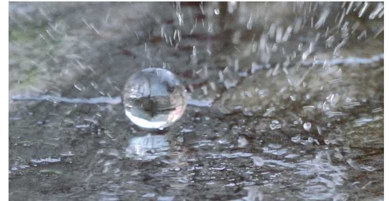
Mikhail Basov. La bagatelle. 2021. (Movie shot)