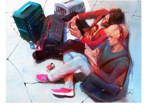
Jan Falk. Home? 2023. Digital oil, Procreate.

Экспозиция выставки родилась из идеи актуализировать привычное понятие «дом» в сегодняшнем мире, щедром на социальные и природные катастрофы. Художникам было предложено зафиксировать любые образы на тему дома вне зависимости, явились ли они итогом их размышлений или же эмоциональных реакций. При этом авторы не были ограничены рамками модальности, жанра или стиля, а в экспозицию принимались как вновь созданные работы, так и спродюцированные более ранними рефлексиями.